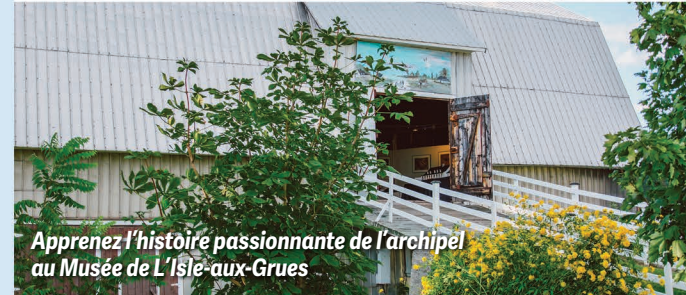
Apprenez l'histoire passionnante de l'archipel au Musée de L'Isle-aux-Grues