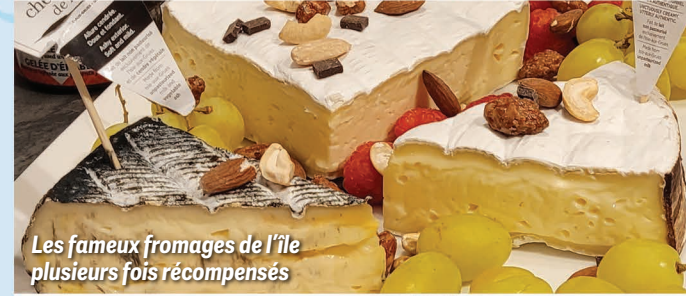
Les fameux fromages de l'île plusieurs fois récompensés