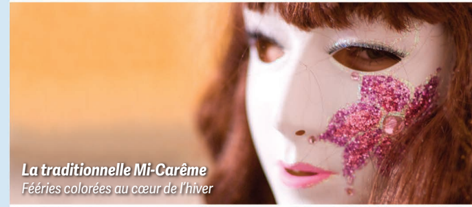
La traditionnelle Mi-Carême Féeries colorées au cœur de l'hiver