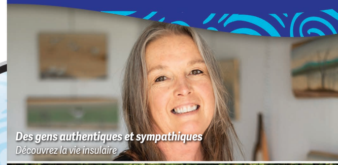
Des gens authentiques et sympathiques Découvrez la vie insulaire