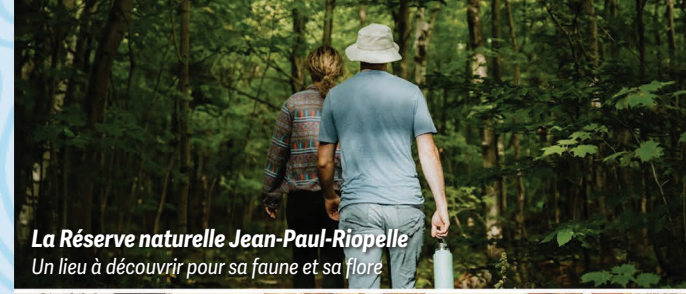
La Réserve naturelle Jean-Paul-Riopelle Un lieu à découvrir pour sa faune et sa flore